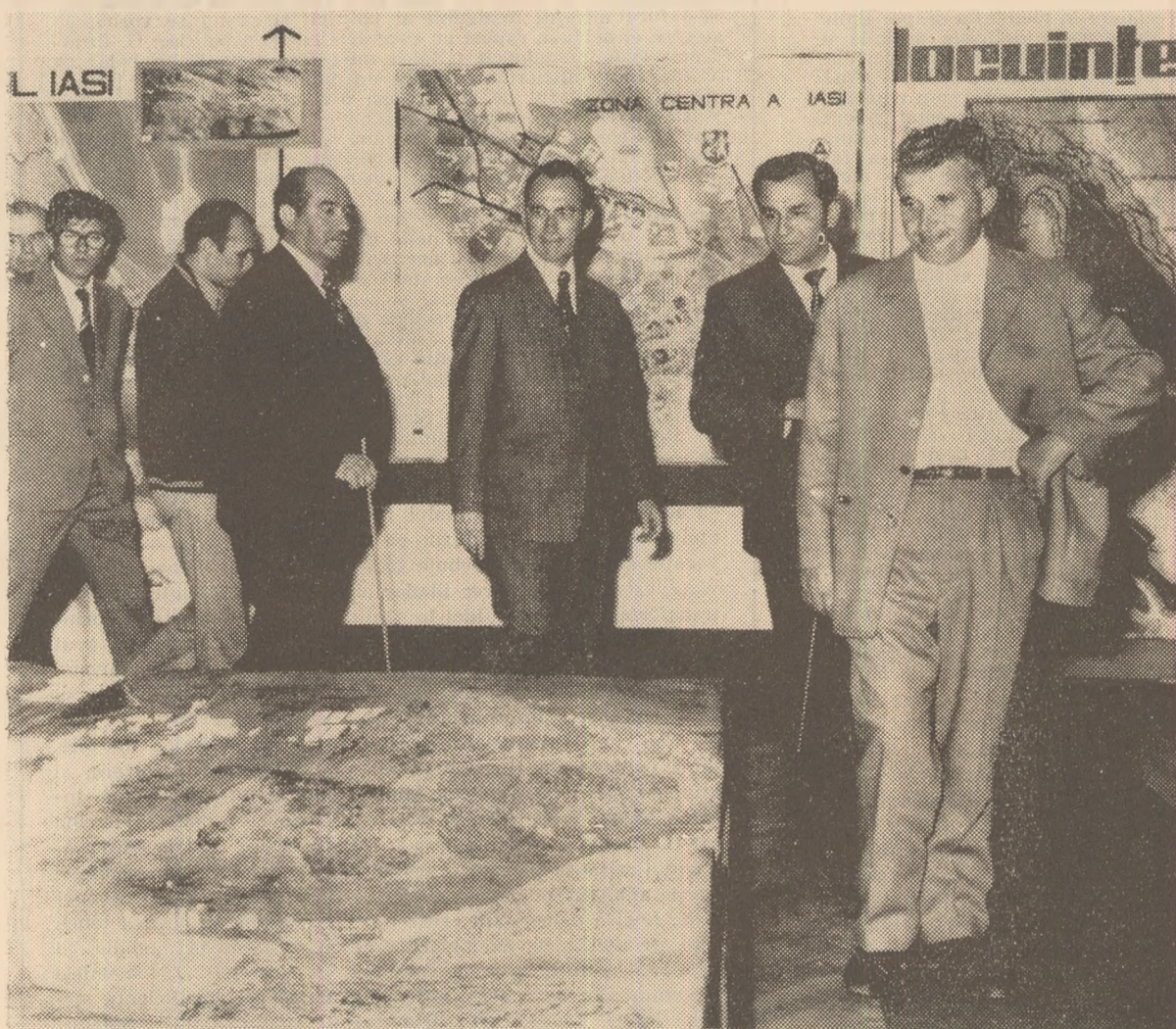
Tovarășul NICOLAE CEAUȘESCU în fața machetelor dezvoltării viitoare a Iașului.

Săptăminal politic-social-cultural editat de Comitetul județean pentru cultură și educație socialistă Iași, anul X nr. 30 (495), vineri, 25.VII.1975, 10 pagini, 1 leu