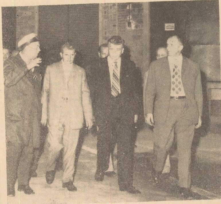
În timpul vizitei la Intreprinderea Metalurgică