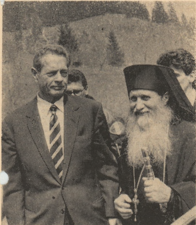
Regele MIHAI I la Putna

3. Reacția grupurilor de oameni care l-au întâmpinat pe Mihai I, regele României, dovedește că se simte un gol imens în spațiul credinței, așteptării și puterii timpului. Se simte lipsa unei autorități reale (și nu doar formale), a unui centru simbolic, spiritual (și nu doar administrativ), a credinței în timpul dat (și nu doar în decăderea lui). Vidul de care s-a tot vorbit la sfîrșitul aceluia halucinant decembrie 1989 nu avea cum să dispară. Conduita neofanariotă a celor care au confiscat puterea și țara l-a făcut să subziste pe mai departe. Se simte încă o teribilă absență stăpînind peste