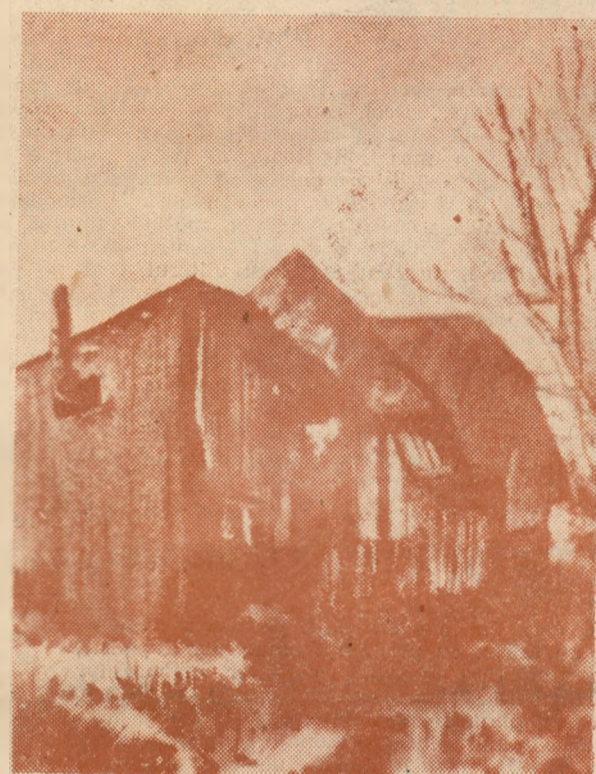
Eugen MIRCEA : „Streșini vechi“