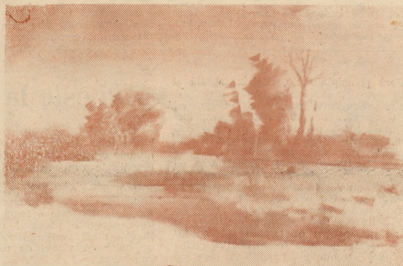
C. RADINSCHI : „Lacul“