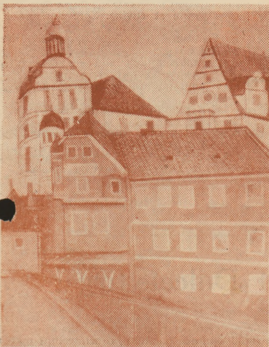
Dan HATMANU : Schlosshaf — Neuburg