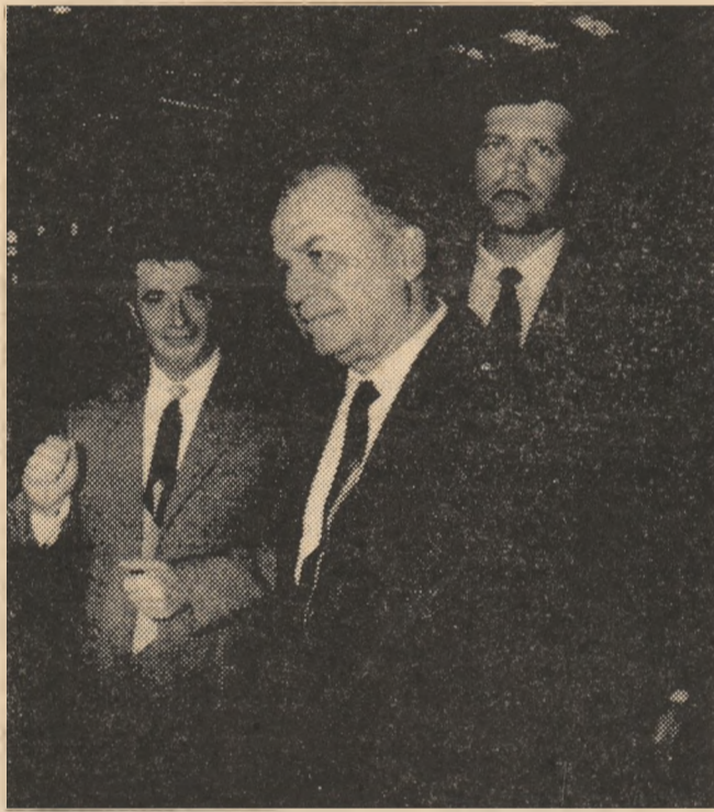
Președintele Ion ILIESCU în vizită la „Fortus“ S.A. Iași