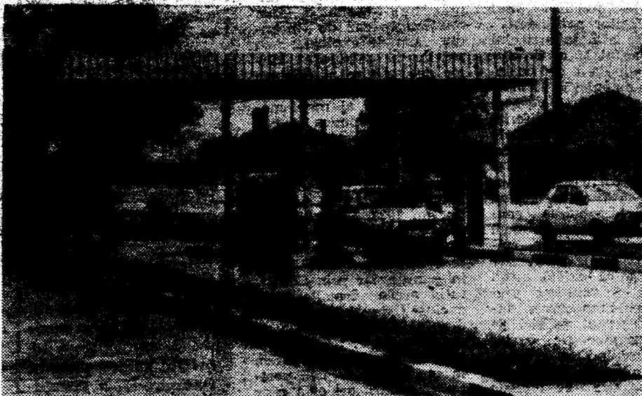
A intrat în funcțiune moderna pompă de benzină din Sintuhatm — Deva.

■ OPERAȚIUNI ANTI-DROG. În cursul unor operațiuni, armata columbiană a distrus două laboratoare de cocaină în jungla amazoniană din sudul țării, au informat surse militare citate de agenția Reuters. Au fost descoperite, de asemenea, diverse arme și cantități importante de substanțe chimice utilizate la obținerea cocainei.