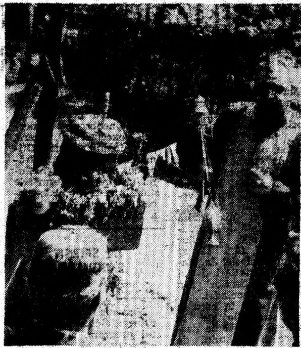
La Cheia, o cruce și un parastas slujit de un sober de preoți amintesc de eroismul moșilor în apărarea pămîntului străbun.