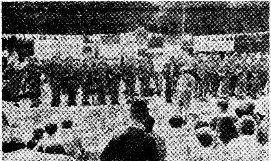
Omagiu ostășesc adus vitejiei străbunilor de la 1849.