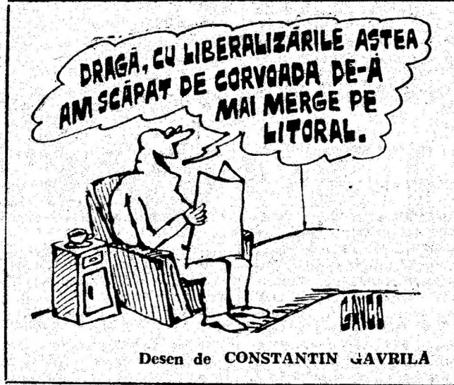
Desen de CONSTANTIN GAVRILA

A doua zi, primește răspunsul: „Tata pregătit. Pregătește-te tu!”