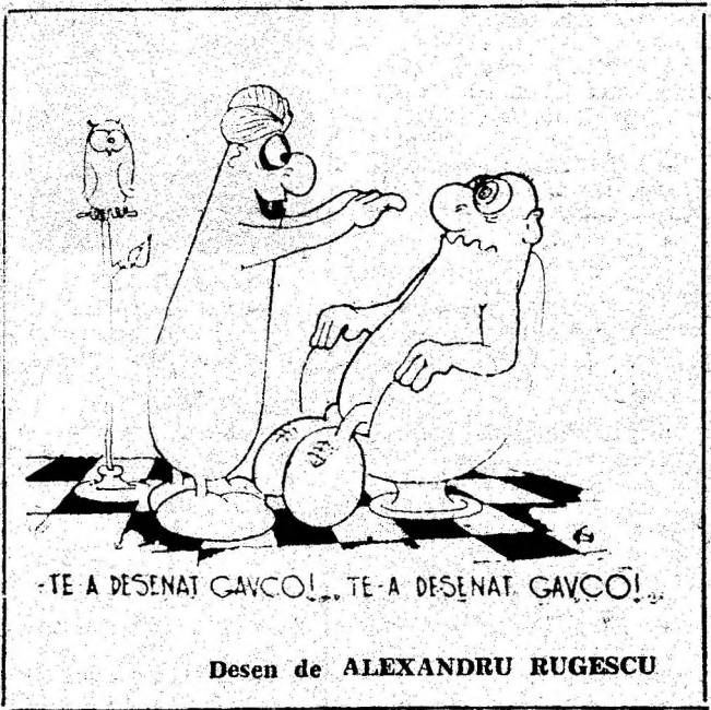
Desen de ALEXANDRU RUGESCU

Un student pică la corigența de toamnă. După examen, temîndu-se de reacția tatălui, telegrafiază fratelui: „Picat la examen. Pregătește-l pe tata”.