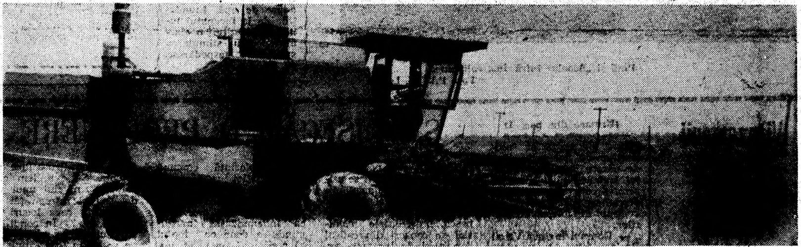
Se seceră din plin!