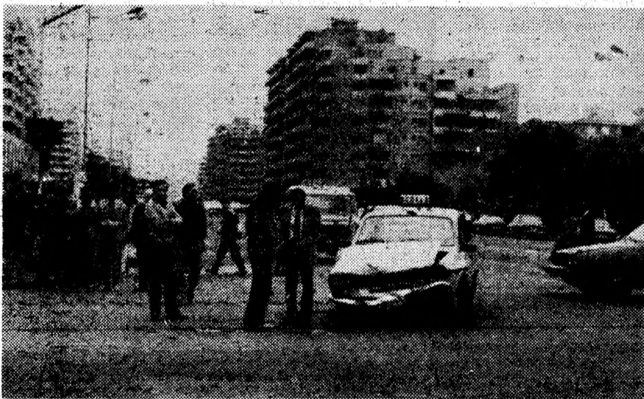
Pînă și „Școala” intră în... coliziune.