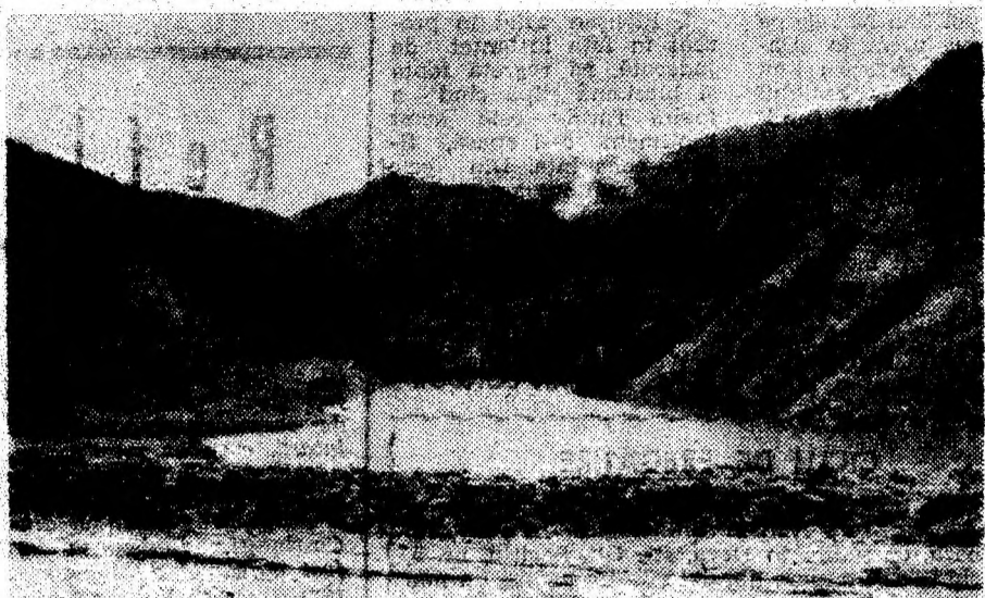
Invitație în Retezat.