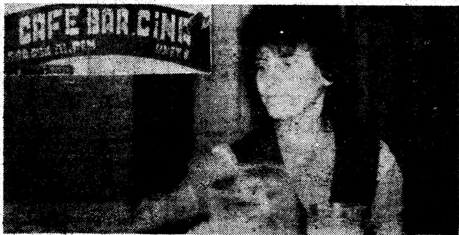
Café-barul „Cina” din Lupeni — o unitate în care comerțul nu se practică în mod civilizată, nu se respectă normele igienico-sanitare, nu se poartă hălate...