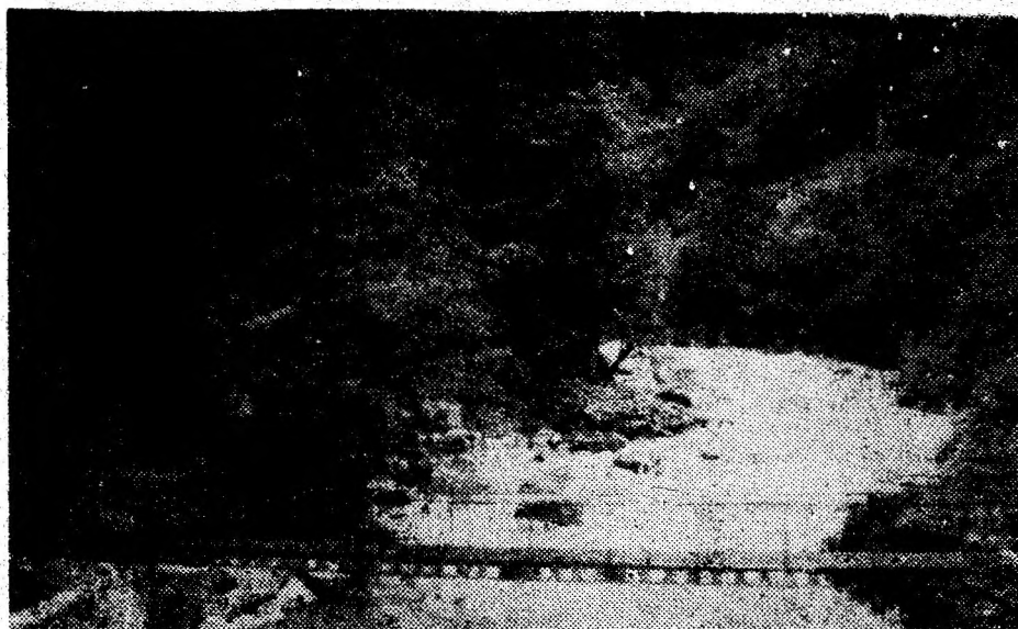
Piriul Lăpușnicului Mare în curgere iute, parcă fierbe.