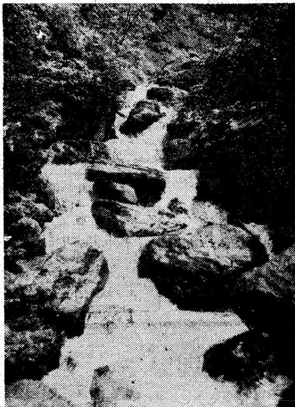
Cascade vijelioase se întîlnesc la tot pasul.