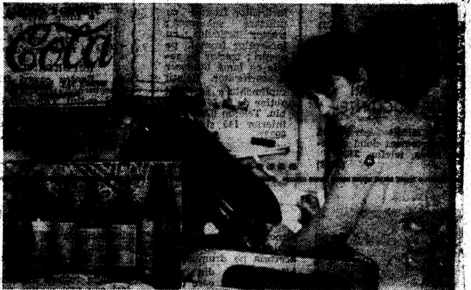
La firma „America's Favorite” din Pui se fabrică băuturi răcoritoare de cea mai bună calitate.