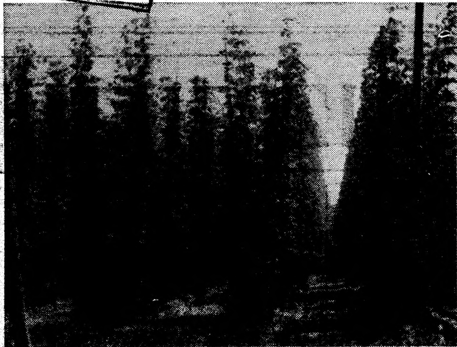
Nu! Nu este o pădure. Imaginea reprezintă un fragment din plantația de hamei a I.A.S. Simeria — ferma de lângă halta C.F.R. Geoagiu.