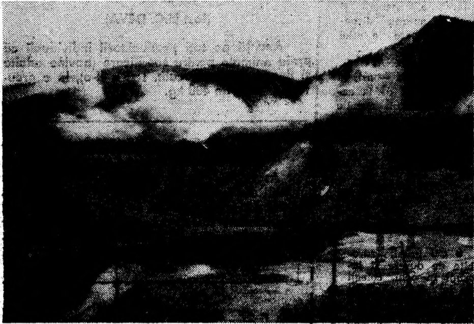
Cerul sărută pământul, sus la Rotunda.