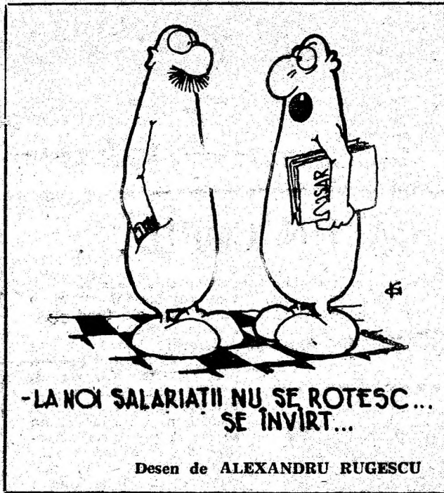
Desen de ALEXANDRU RUGESCU