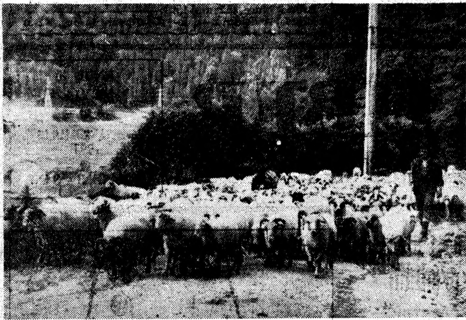
Mioarele urcă spre bogatele pășuni ale munților.