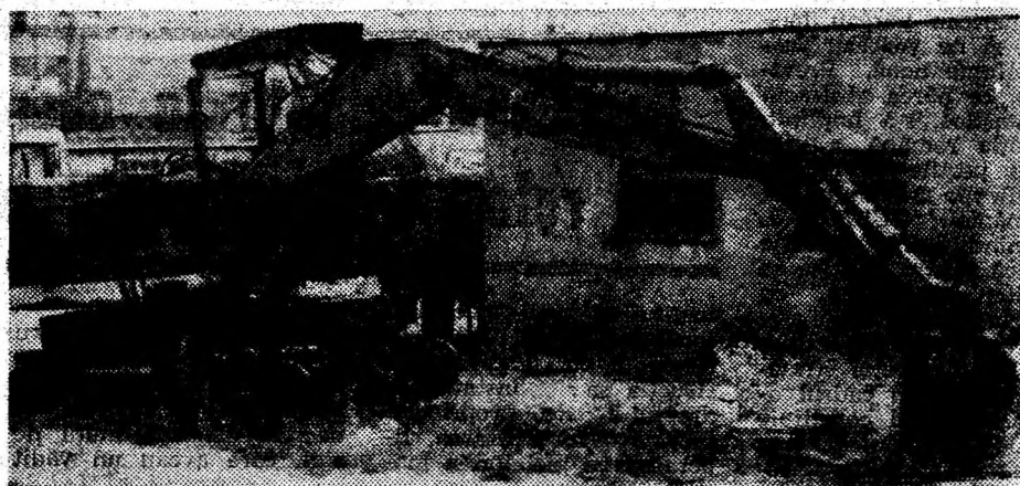
Un „CASTOR” care își plînge tinerețea.

În câteva cuvinte și imagini dorim să vă prezentăm, stimați cititori, sediul și curtea Exploatării de Gospodărie Comunală și Locativă din Călan, deci ale primilor gospodari ai orașului. Nu pentru că am avea ceva în mod deosebit cu dumelelor, că printre toate, face și lucruri bune, dar un duș rece în plină vară face bine oricui. Sperăm că nu va face nimeni pneumonie, chiar dacă în ziua documentării noastre ploua. În ideea că totul va decurge bine în continuare, că se va face ordine, că spiritul gospodăresc va triumfa pînă la urmă, dorim lucrătorilor și conducerii amintitei, mai sus, uniți, cu sinceritate, succes!