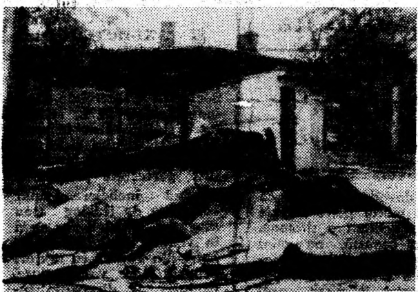
Un morman de fier vechi care nu știe cum să treacă strada în combinatul siderurgic care l-ar repune în... drepturi.