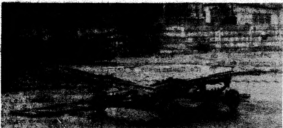
O remorcă ce așteaptă un întreprinzător.

În câteva cuvinte și imagini dorim să vă prezentăm, stimați cititori, sediul și curtea Exploatării de Gospodărie Comunală și Locativă din Călan, deci ale primilor gospodari ai orașului. Nu pentru că am avea ceva în mod deosebit cu dumelelor, că printre toate, face și lucruri bune, dar un duș rece în plină vară face bine oricui. Sperăm că nu va face nimeni pneumonie, chiar dacă în ziua documentării noastre ploua. În ideea că totul va decurge bine în continuare, că se va face ordine, că spiritul gospodăresc va triumfa pînă la urmă, dorim lucrătorilor și conducerii amintitei, mai sus, uniți, cu sinceritate, succes!