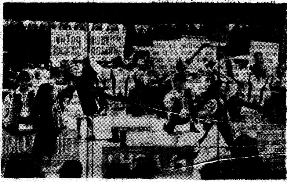
Noti sintem români.