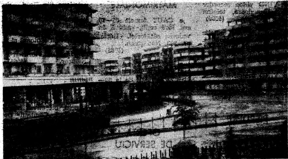
Deva după ploaie.