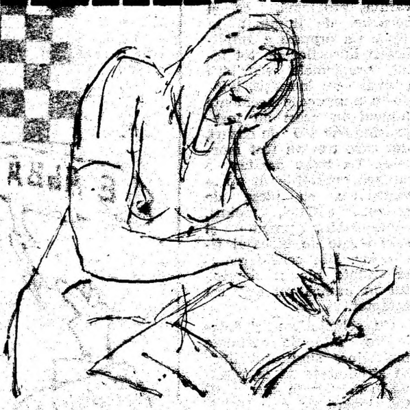
LECTURĂ - desen de DORINA ITUL CRĂNG