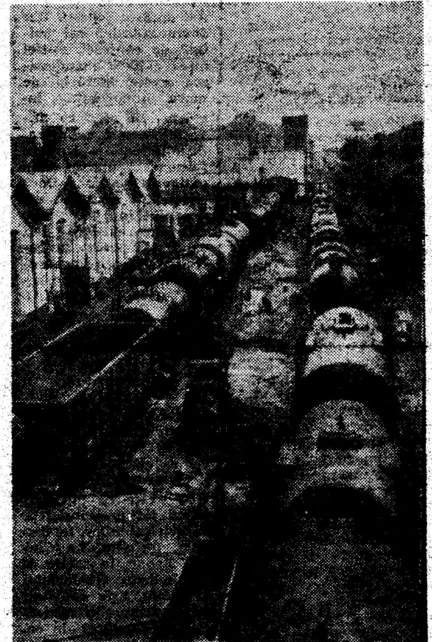
Simeria — I.R.M.R. Cisternele intră ca pe bandă rulantă la reparat.