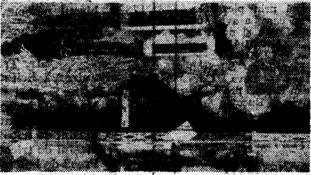
In magazinul „COMFRUCT”, din Complexul Central Piață, abundență de mărfuri.

Deci să cumpărăm pămînt pe post de morcovi, preferăm un preț mai mare, dar la o marfă bună. Răspunsurile de mai sus denotă că unii se desprind greu de concepțiile lor mai vechi potrivit cărora, dacă are nevoie, omul cumpără orice. O concurență adevărată, într-o economie de piață adevărată, nu mai poate admite în comerț purtători ai unor asemenea concepții.