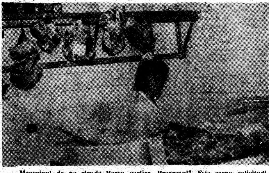
Magazinul de pe strada Horea, cartier „Progresul”. Este carne, solicitudine din partea vinzătorilor, dar prețurile sînt cumplite...