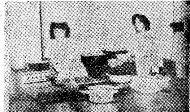
La unitatea „Tosca” din Hunedoara, Protecția consumatorilor este garantată de produsele de calitate...