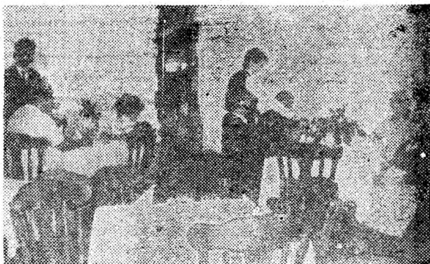
Stațiunea Geoagiu-Băi. Ce se pune pe masa oamenilor este bun, proaspăt, în cele mai desăvîrșite condiții de igienă și curățenie.