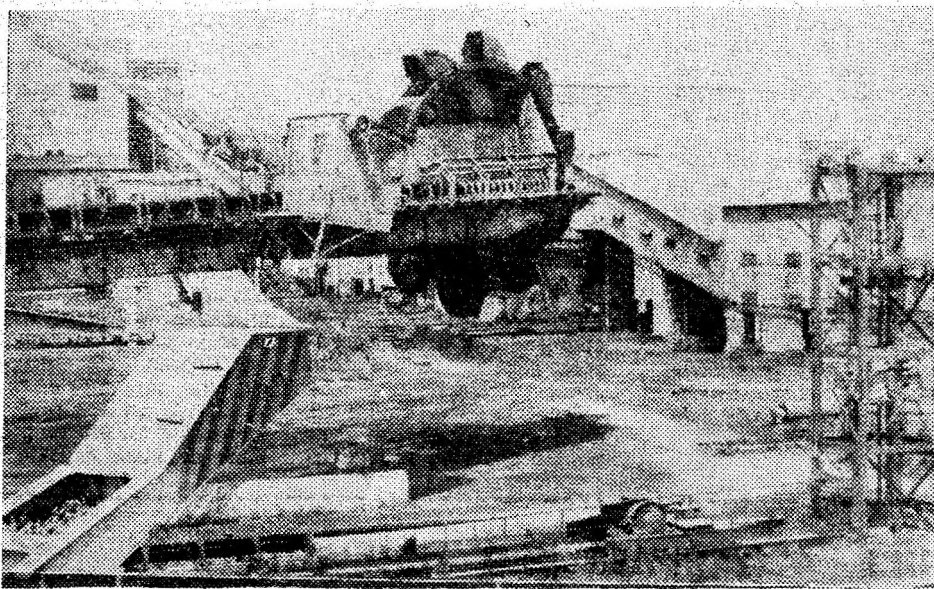
Imagine din depozitul de cărbune. Nici o activitate. Marile mașini de încărcat șomează...

A-l evoca pe Badea Cîrțan în acest august, cînd comemorăm 8 decenii de la trecerea sa în veșnicie, înseamnă a restitui în suferințele ardelenilor o rază de lumină. Însăși amintirea lui Badea Cîrțan este o restituire de lumină într-un timp tulburat de dezbinări și rea-voință.