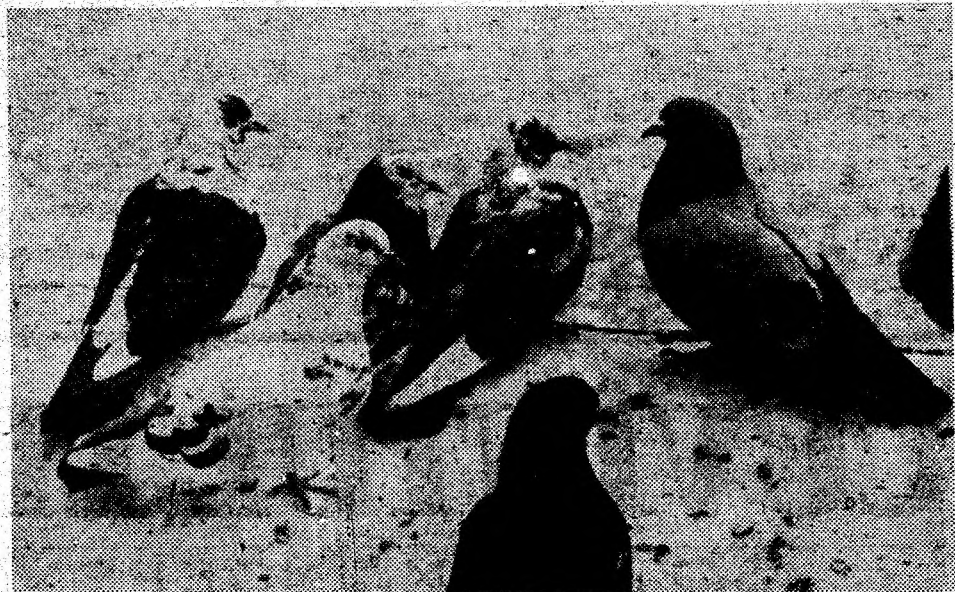
IOAN MATEI: Porumbei.