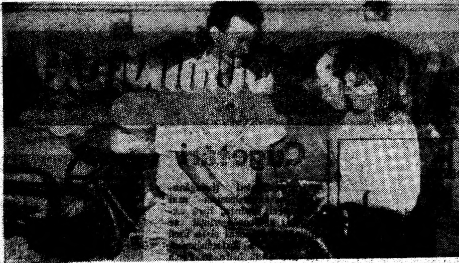
Ajutoarele pentru sinistrați se sortează cu grijă.