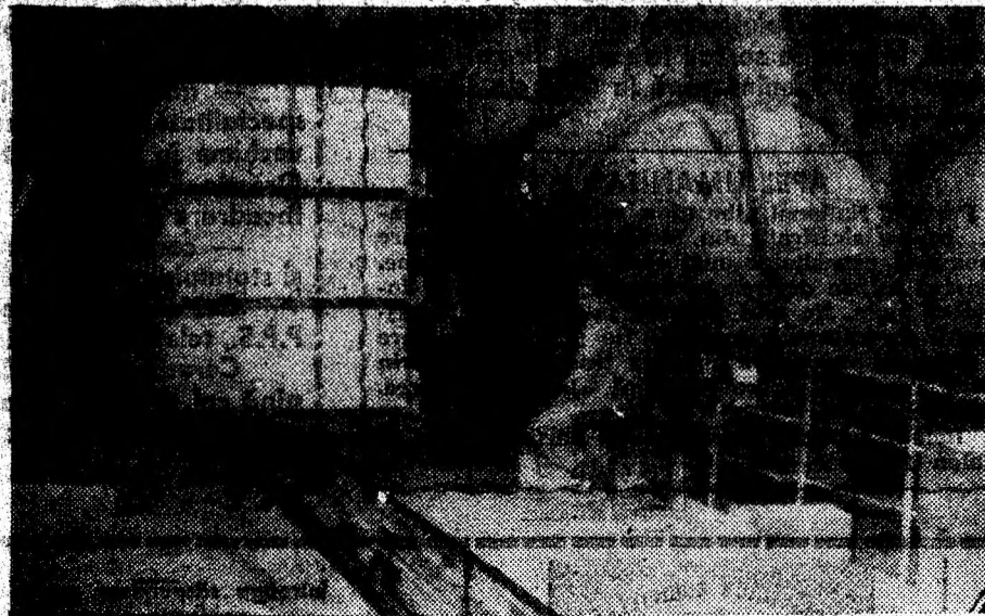
O nouă șarjă de b.c.a. iese din cuptor, luînd drumul beneficiarilor.

O rază de speranță apare pentru secția respectivă, din Republica Moldova existînd o solicitare de 100 km tuburi pentru irigații de 4—15 atmosfere. Rămînde doar de perfectat sistemul barter.