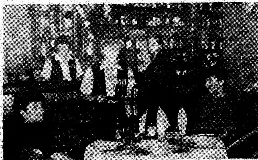
Aspect din interiorul restaurantului-bar: intim, cochet, elegant, primitor.