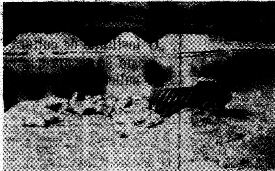
Gelmar. Aici se construiește un nou pod peste riul Mureș.

— Noi vă dorim succes, astfel ca pe Riu Mare să curgă mulți, mulți ani cantități continue sporite de energie electrică.