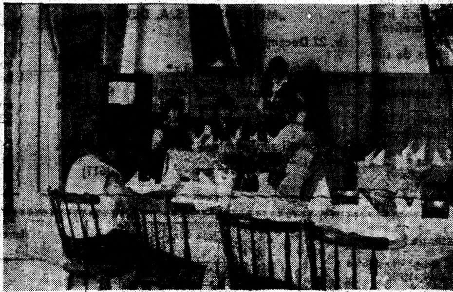
Personalul restaurantului din cadrul complexului „Mureșul” asigură o servire plină de politețe.

În vederea unei mai bune prezentări a mărfurilor, se așteaptă un mai mare sprijin din partea U.J.Coop. Deva, în aranjarea vitrinelor și în realizarea unei reclame eficiente.