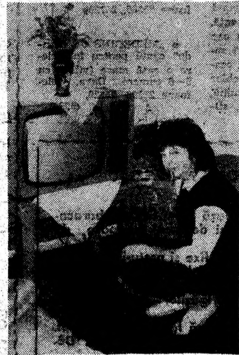
Complexul „Mureșul” asigură turiștilor excelențe condiții de cazare.

Gestionarea magazinului „Confecții” a procurat stocuri de făină ce au trecut cu piinea caldă. De altfel, aprovizionarea rețelei de desfacere — departe de a fi încă multumitoare — este o atribuție ce și-o asumă cu răspundere toți cei 120 de lucrători ai cooperativei, în frunte cu conducerea acesteia