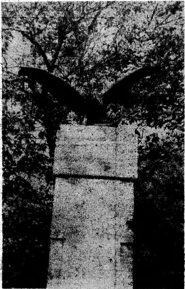
Monumentul eroilor satului din Gelmar.