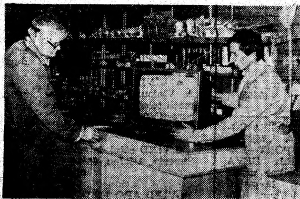
Magazinul „Electronica” oferă cumpărătorilor o mare varietate de mărfuri.

țicole pentru toamnă-iarnă • Au trecut 8 luni din acest an. Cu ce bilanț le-ați încheiat? La finele perioadei respective, am înregistrat o depășire a programului la desfacerea de mărfuri de 17 la sută, iar la industria mică și prestări servicii de 12 la sută