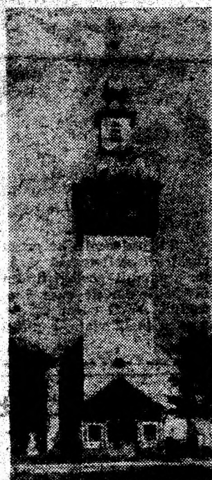
Biserica din Gelmar.