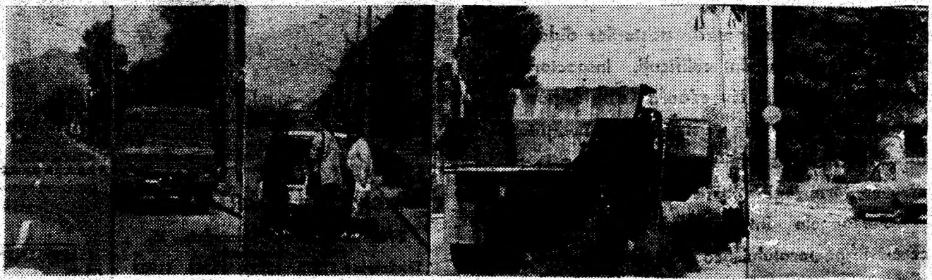
Doar în cîteva minute, am surprins în obiectiv două Dații, un ARO și o autobasculantă oprind sau chiar staționînd în fața semnelor „Oprire interzisă”, amplasate pe bulevardul din cartierul Aeroport — Petrosani.

Sonda] de opinie realizat de ESTERA SINA