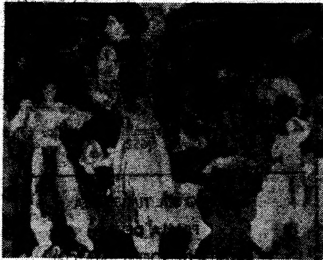
Cu gândul la expoziția retrospectivă a pictorului Iosif Matyas.