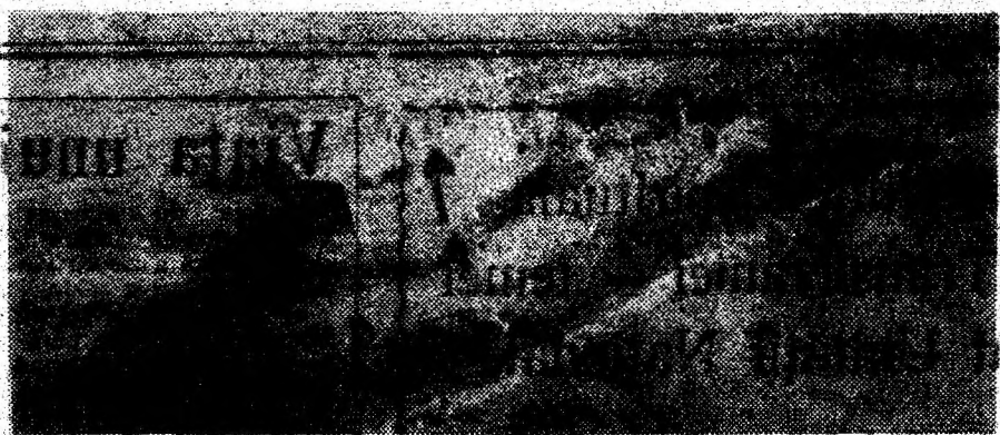
Cătelea Devel. Vedere aeriană.