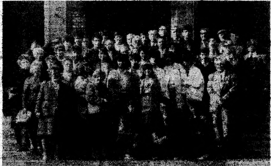
CORUL CATEDRALEI ORTODOXE ROMÂNE DIN HUNEDOARA