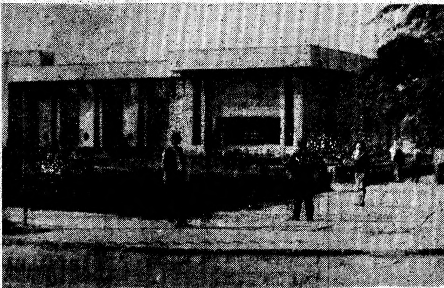
Casa de cultură din Călan.