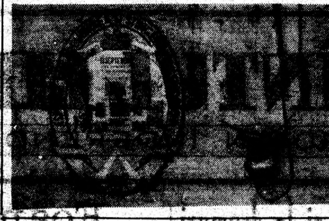
Lângă emblema pompierilor din Deva, ca o sfidare, stă dispus un tablou cu legătură electrică. Poate a fi, poate nu e bine - alții să ne judece.