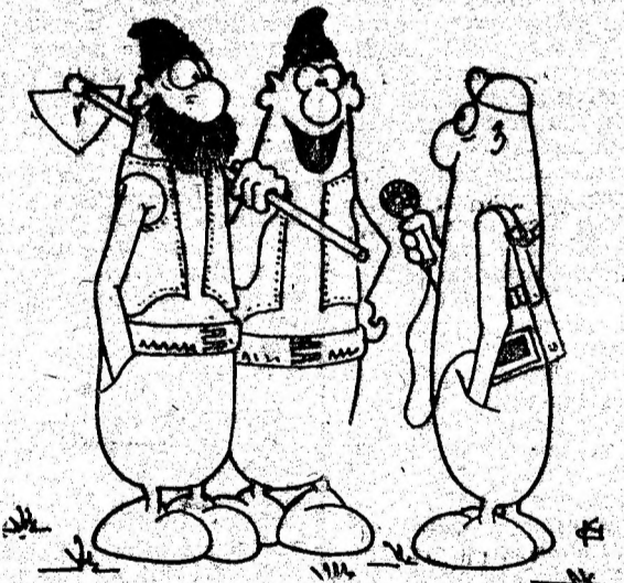
— Sigur, domnule dragă, am semănat și noi pîntă și-a lăsat Pătru barbă... Desen de AL. RUGESCU