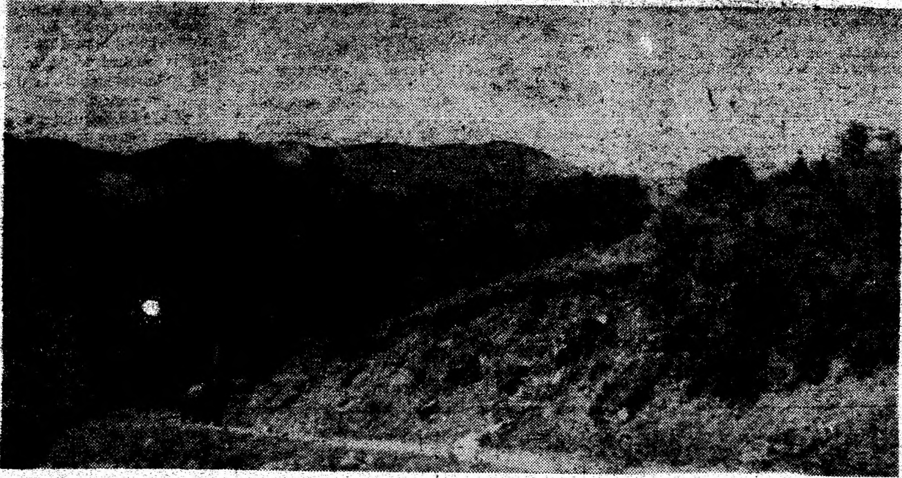
Pe drumuri de munte.

În paralel s-a desfășurat cursul intensiv postuniversitar „Lentile de contact”, precum și masa rotundă cu tema „Glaucomul cu presiune joasă”. Manifestarea științifică a fost onorată și de prezența unor specialiști din Germania și Ungaria, a acestora aducînd și unele ajutoare. Trei firme prestigioase au prezentat, în cadrul unei expoziții, aparatură specifică domeniului oftalmologic, organizarea unor asemenea manifestări dovedindu-și din plin utilitatea. (N.T.)