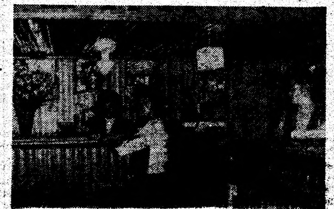
Barul de zi „Union” din Călan — o unitate bine aprovizionată și cu bună servire.

Am văzut, și mi s-a umplut inima de duioșie, cum oamenii iau apă de la Boholt. De la izvorul ce vine din adîncurile noastre de români stăpîni aici de cînd e pămîntul. Gîndul meu este unul bun: să ne ocrotim, să ne iubim izvoarele care ne-au adăpat, care ne potolește și astăzi setea de drag pentru pămîntul din care vin spre noi izvoarele străbunilor. Izvoare pe care nu le vom lăsa să sece niciodată! (Gelu Negrea)