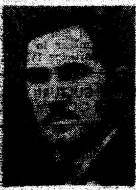
El care rezista in spatele frontului sovietic de cinci zile. Am coborit, jos de jos, si am aruncat horta

intregului front, pus in- tr-un saculet cu nisip — care avea o coada lunga de 12 m — ca sa poata fi yastita usor si pe care o aveam in dotarea avio- nului de recunoastere. Unitatea a primit-o. Noaptea, a spart frontul sovietic si a venit 60 de km pina a ajuns la un- tatile noastre, dupa o e- devratata odisee. Am stabilit mai apoi ca era vorba de batalio- nui I din regimentul 15 Dorobanji, din Piatra- Neamt, de sub comanda majorului Hăgădănescu. Lupta si curajul lor au adverit ascendența in