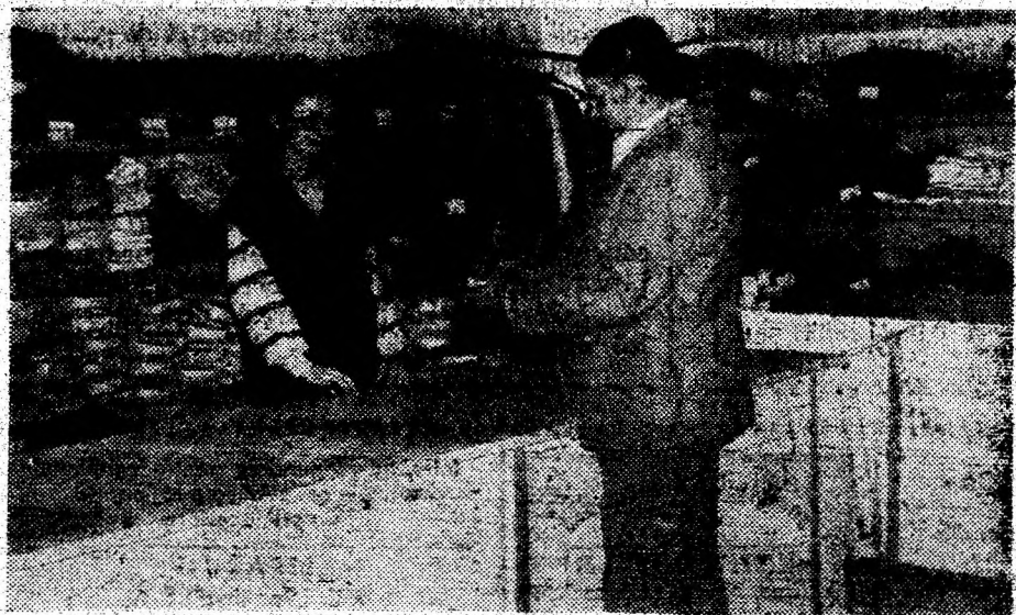
Pozițiți la magazinul nostru (de lângă depozit)! Veți găsi aici cele mai ieftine mărfuri, veți fi întâmpinați cu amabilitate.

Un argument în plus ca să le treceți pragul!