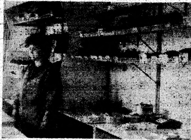
Pentru posesorii de autoturisme, magazinul auto-moto, la dispoziția tuturor.