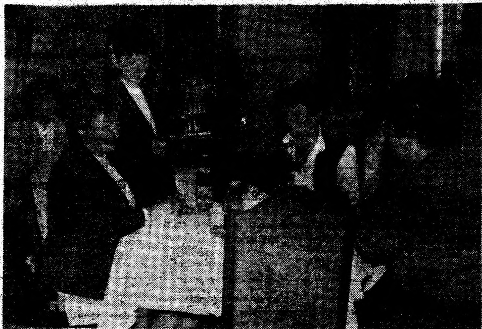
„Central” — o unitate de referință în alimentația publică din orașul Brad.