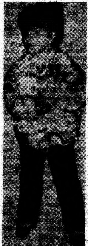
— Nu știți unde se organizează parada modei pentru copii ?