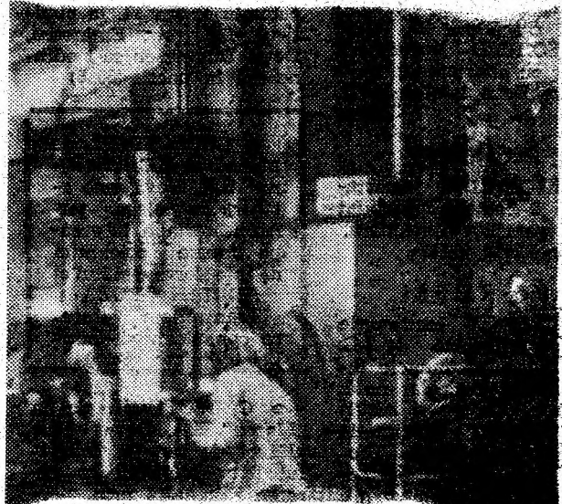
Prelucrări mecanice pe mașini unelte.