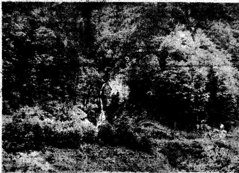
Toamnă în Rețezat.