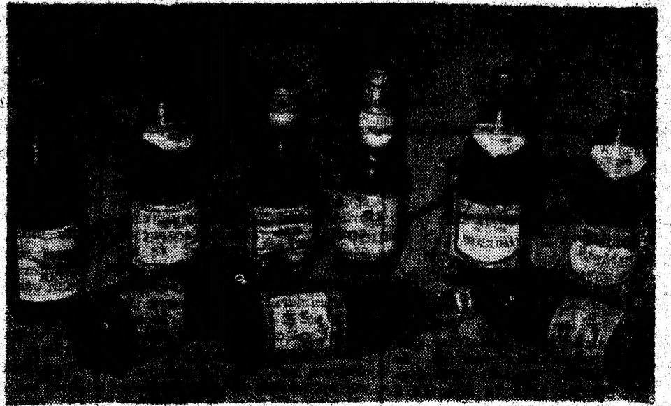
Una dintre expozițiile societății comerciale HABER S.A. Hațeg, care prezintă produse sale, de bună calitate.

„PUBLICITATE” „PUBLICITATE” „PUBLICITATE” „PUBLICITATE”