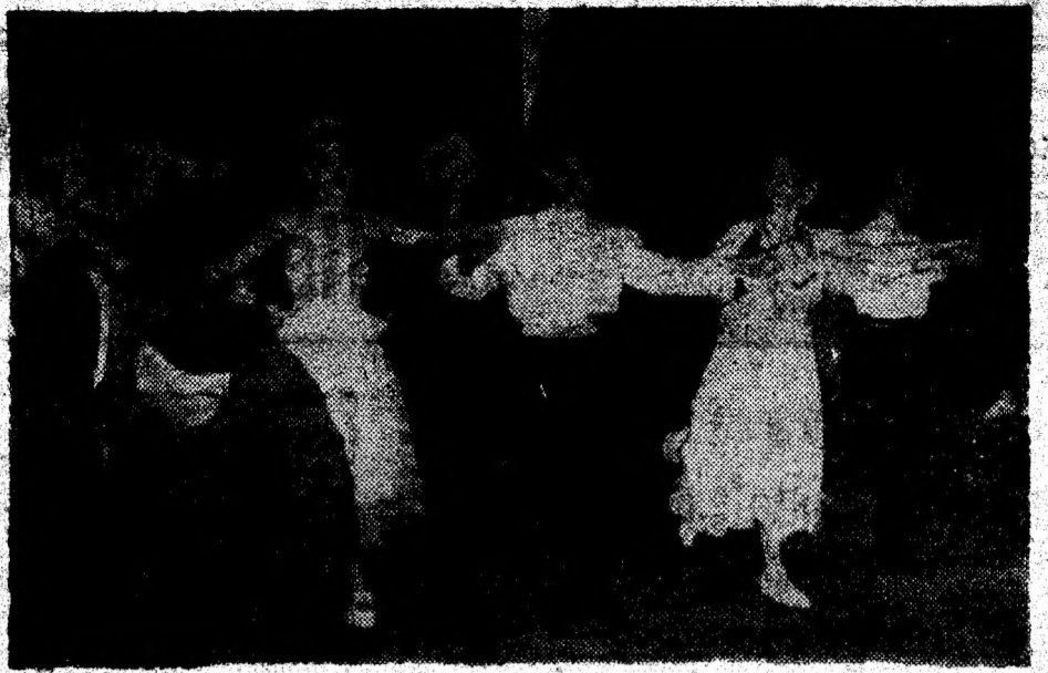
Aspect din timpul desfășurării festivalului.