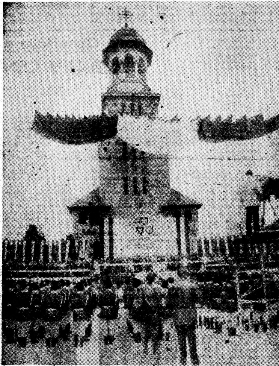
Alba Iulia — 1 Decembrie 1990. Din Catedrala Intregirii Neamului, s-au desprins aripi tricolore!