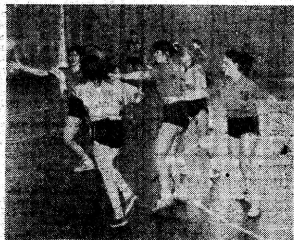
REMIN, tînăra echipă deveană de la care se așteaptă mai mult la reluarea campionatului.