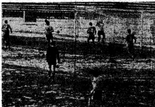
Fază din meciul Corvinul — Dinamo. Un nou atac al Corvinului oprit de Tene.