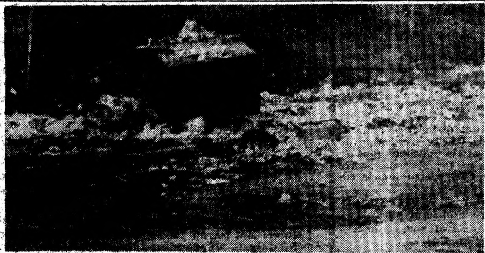
„Un peisaj pe care-l întâlnim mereu. Acesta este din zona Gării Deva.