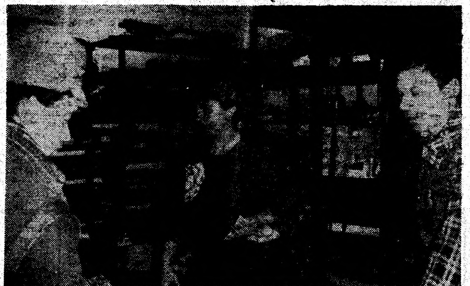
PAMI Deva — un magazin bine aprovizionat.