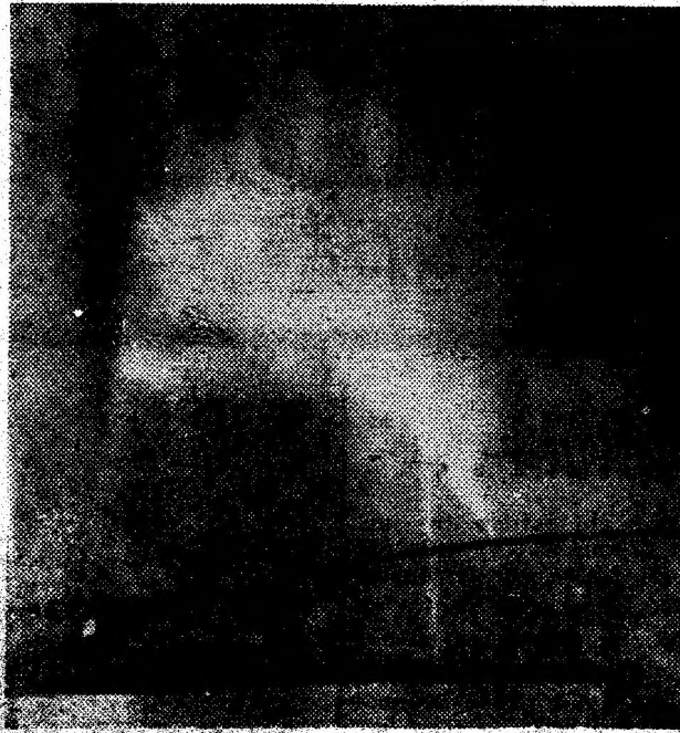
Secția de mobilă Petrila, a S.C. „Sarmismob” S.A. Deva. Aburul tehnologic se pierde în eter pentru a nu... îngheța în conducță.

În acest caz, fotoreporterul Pavel Laza a prins pe peliculă ce a văzut în exterior: șanturi neacoperite și movile de pămînt, diferite materiale aflate în dezordine și mai ales: conducția de abur tehnologic din imagne. De ce refulează non-stop din această conducță aburul în atmosferă? Pentru a nu îngheța în conducță, ne-a spus tehnologul secției. O fi... Dacă spune tehnologul... (D.G.)