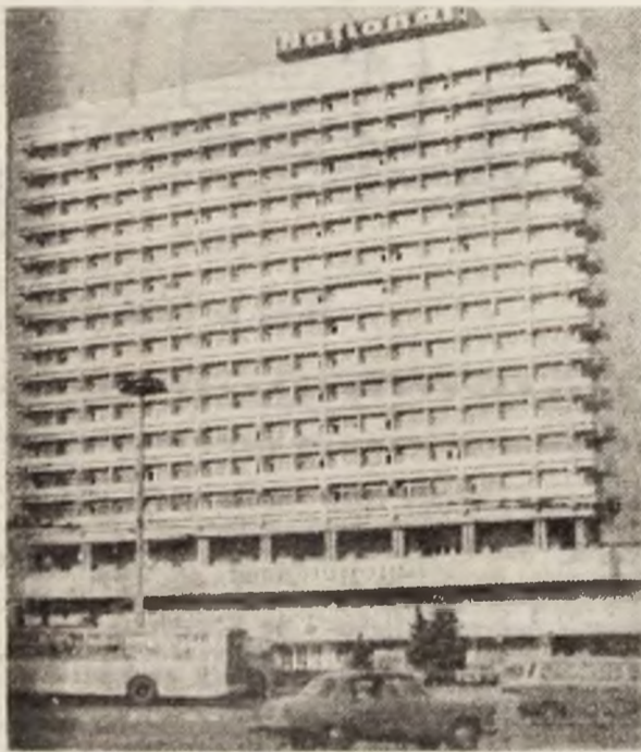
Chișinău. Hotelul „Național”.