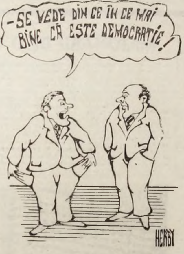
Desen de GILV. HARBAN

În ultima vreme, în Deva, mai mulți locuitori ai orașului și-au exprimat nemulțumirea cu singurul magazin specializat de desfacere a peștelui și produselor derivate, din incinta „Complexului Comercial Central” Piața Deva a fost desființat, faptul împlindu-se la începutul anului 1991. În locul acestuia funcționează, în prezent, o unitate alimentară, particulară, schimbîndu-se practic profilul activității, deși amenajarea interioară este destinată comercializării peștelui proaspăt, congelat și a altor produse din pește.