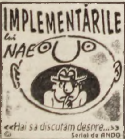
«Hai să discutăm despre...» Serial de RANDO