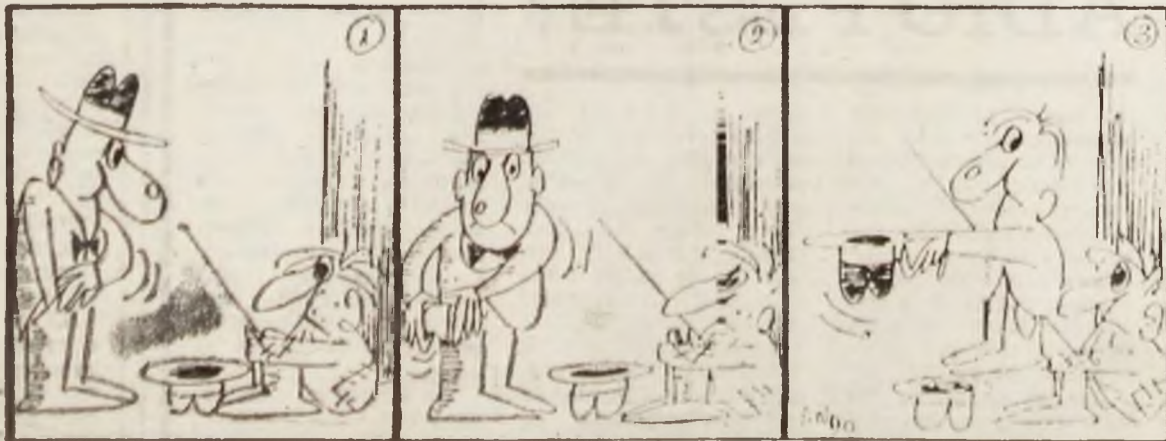
Serial cu apariție simultană la București, Timișoara, Craiova, Deva și Constanța.