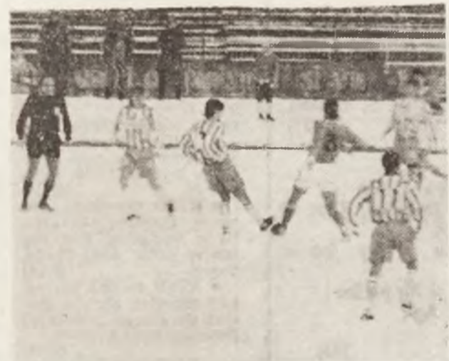
Pregătirile fotbalistilor au început și se desășoară și pe zăpadă.

Iată care este ordinea disputării meciurilor din grupa a 4-a preliminară pentru Campionatul Mondial de fotbal din S.U.A., 1994: În anul 1992 — 6 mai: România — Insulele Feroe; 20 mai: România — Țara Galilor; 12 octombrie: Belgia — România; 11 noiembrie: România — Cehoslovacia; 29 noiembrie: Cipru — România. În anul 1993: 14 aprilie: România — Cipru; 2 iunie: Cehoslovacia — România; 8 septembrie: Insulele Feroe — România; 13 octombrie: România — Belgia; 17 noiembrie: Țara Galilor — România.