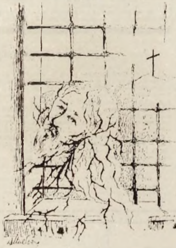
Desen de DORINA ITUL CRĂNG

Povestirea în povestire, secvențele retrospective și mai ales, introspective —