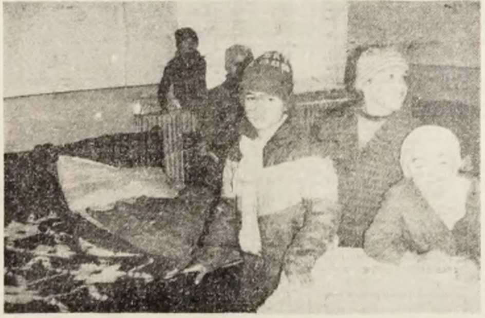
În dormitoare, acolo unde se adăpostesc cînd le e frig, copiii de la Casa de Copii Școlari Baia de Criș așteaptă o mișcare, o vorbă bună. Să nu-i lipsim de căldura inimii noastre!

PALATUL ADMINISTRATIV SI. GROAPA LUL. Cîitorii nostri au înțeles că este vorba de Palatul Administrativ din Deva. Aici își au sediul o seamă de instituții din județ, foarte mult sollicitate de cetățeni. Nu le enumerăm pentru că lista ar fi prea lungă. Vom spune, cu țință de rîsuare, că în fața intrării principale o grupă mare și alină „păzește” treptele. De luni și luni te zice. Cine a făcut-o a avut un scop. Normal, nu? Să te alina ori ba, nu știu. Dar groapa ar trebui totuși acoperită. Nu? (N.T.)