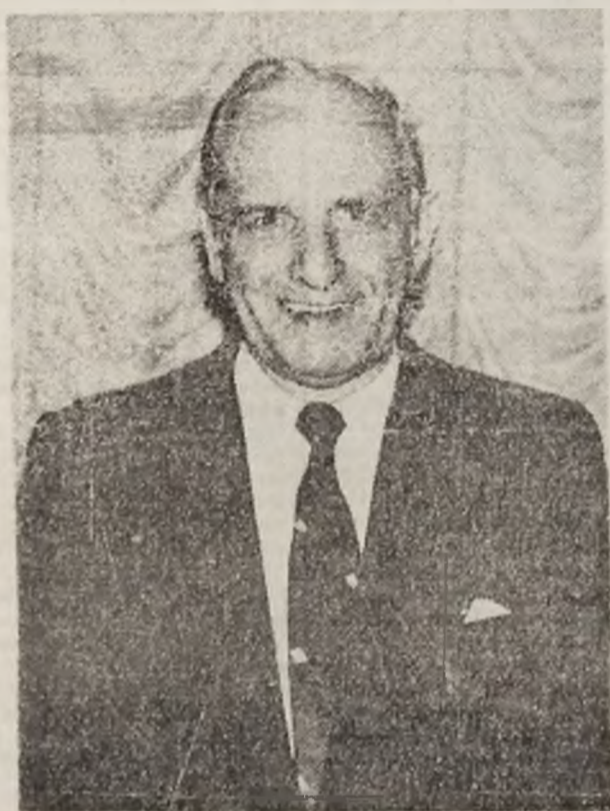
Un zimbet și un autograf de la Stefan Bănică.