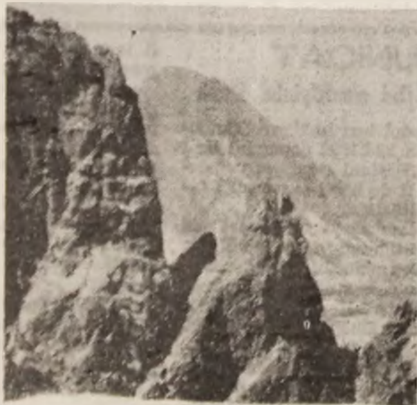
Munții Retezat, Colții Peleaga și virful Retezat.