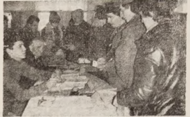
Hateg. Votarea s-a desfășurat fluent, în ordine.