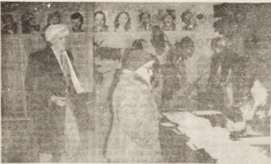
Hunedoara. Deplină libertate în exprimarea opțiunilor.