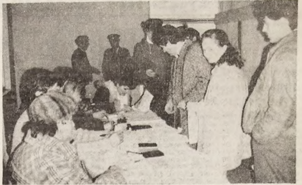
Deva. Și la secția de votare nr. 18 alegătorii s-au prezentat la urne de la primele ore ale dimineții.