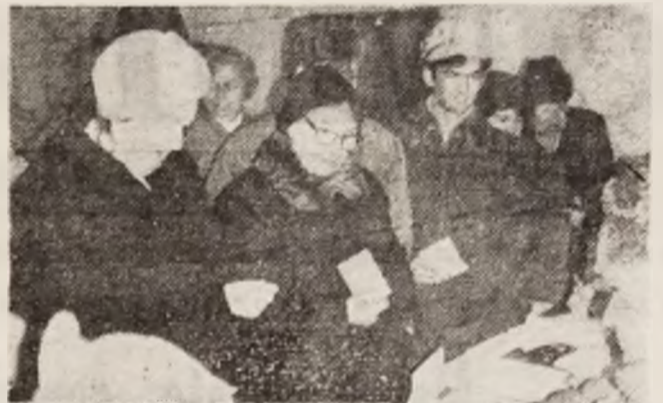
Călan. Cu toate neregulile înregistrate, cetățenii au participat în număr mare la vot.