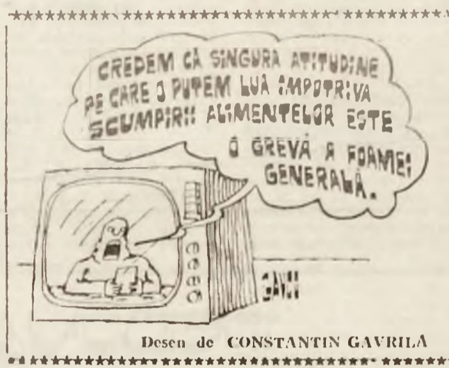
Desen de CONSTANTIN GAVRILA