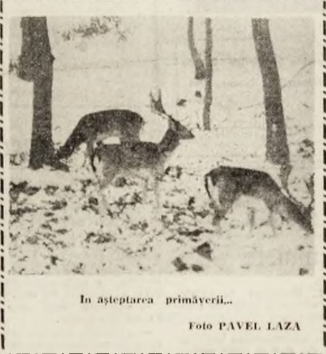
În așteptarea primăverii...