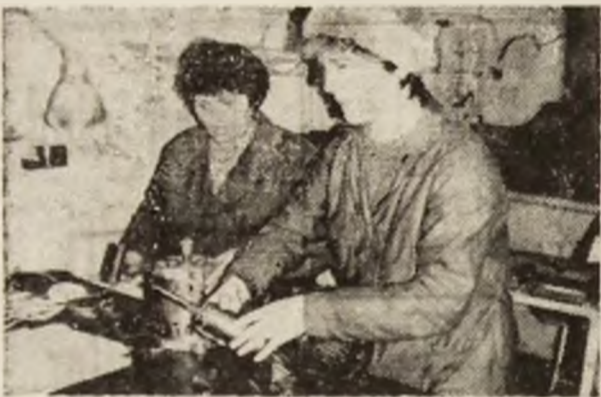
Calitatea reparațiilor electrice în secțiile U.P.S. R.U.M. Deva — o garanție a comenzilor dumneavoastră.

duse din cauciuc și de turnătorie, execută reparații, încercări și verificări ale acestora, tratamente termice, acoperiri electromecanice, alte prestații în domeniu. În puțini ani de existență, aici s-a consolidat un colectiv puternic, cu oameni de înaltă pregătire profesională, care s-au impus prin operativitatea și calitatea lucrărilor executate, atrăgând an de an noi parteneri de afaceri. În actualele condiții de trecere la economia de piață, U.P.S.R.U.M. Deva își diversifică permanent activitatea, își extinde gama prestațiilor, produsele sale fiind o certă garanție a contractelor cu beneficiarii.