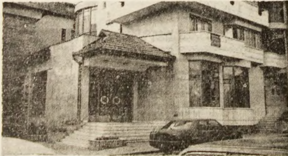
„Decebal” — singurul hotel cu patru stele din județ.

partenerul hotelului „Decebal”. Localul și expoziția culinară organizată oferă o gamă variată de menuri și băuturi.