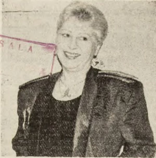
Un zimbet de 8 Martie cu... Mirabela Dauer.