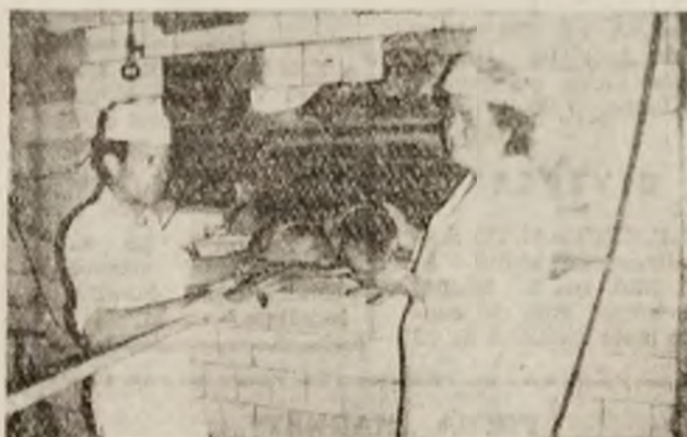
La Dobra, brutării își onorează meseria, făcînd piină bună.