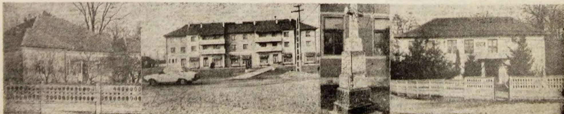
Imagini din centrul comunei Bretea Română,