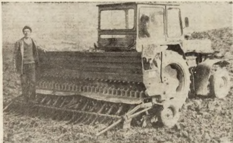
La Hărău se seamănă griu de primăvară.

Ce se va întimpla cu miile de oameni lipsiți de o bucată de piine, după expirarea perioadei de șomaj? Este una dar și poate cea mai importantă problemă pentru care actualii guvernanți al țării ar trebui să nu aibă somn. Și aceasta întrucît se face direct răspunzător de situația gravă prin care trece România. CORNEL POENAR