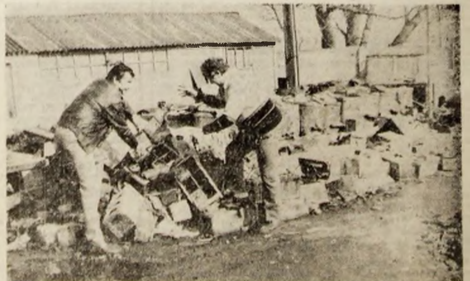
Una din activitățile importante de recuperare și refolosire este și aceea care privește strîngerea plumbului din acumulatori uzați.

La presa pentru hîrtie și cartoane se balotenză aceste materiale, care apoi sînt expediate fabricilor de profil, dîndu-li-se o nouă întrebuintare.