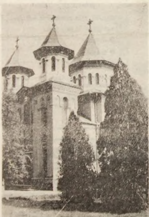
Biserica ortodoxă din Călanul Vechi.

Întrecerea de a lua, la sfârșitul săptămânii trecute, pulsul muncii din agricultură pe o însemnată rază de activitate, în ciuda așteptărilor optimiste, s-a soldat cu o totală dezamăgire. Avînd în vedere că la o serie de lucrări existau mari restanțe din toamnă și cum starea vremii era favorabilă, am pornit cu gîndul că pe cîmp voi întâlni o vinzoleală de nedeseris. Dar n-a fost să fie așa.